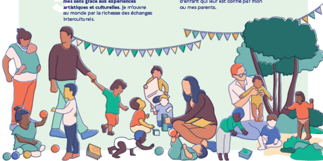
Cette charte établit les principes applicables à l'accueil du jeune enfant, quel que soit le mode d'accueil, en application de l'article L. 214-11 du code de l'action sociale et des familles. Elle doit être mise à disposition des parents et déclinée dans les projets d'accueil.