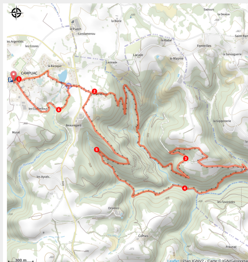
Le bois de Teyssières

Une randonnée au milieu d'une vallée profonde au cœur du bois des Teyssières, plongée dans les contreforts du plateau de Campuac