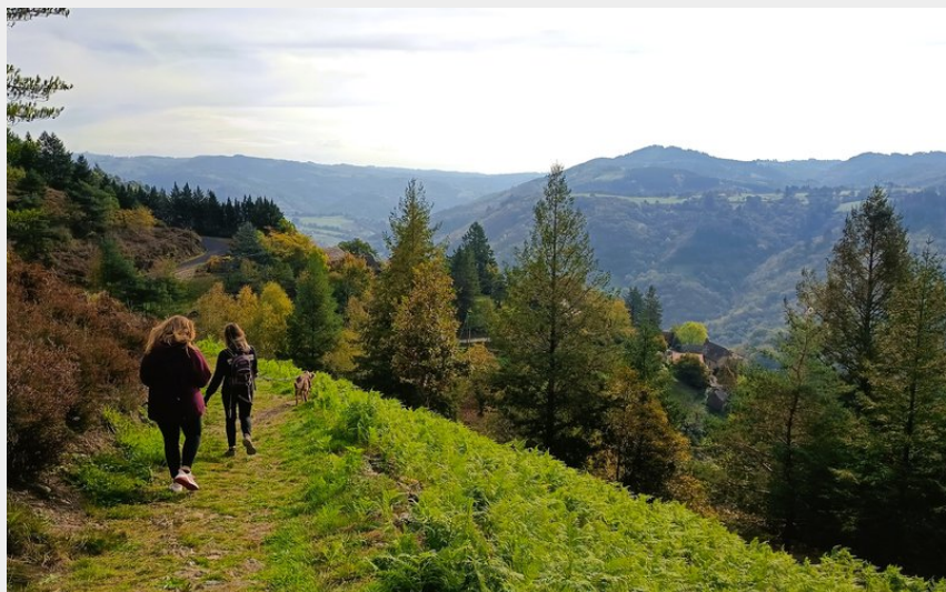
Sur les coteaux du Fel