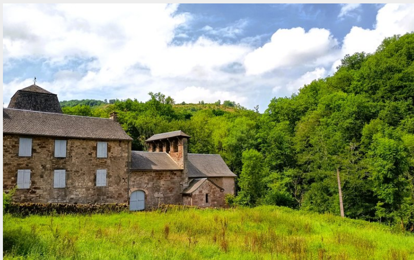
Le monastère de Cohulet