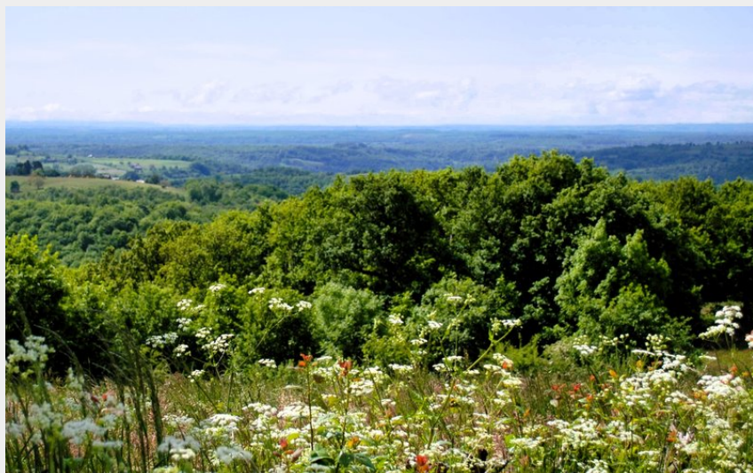
Point de vue depuis le plateau de Campuac