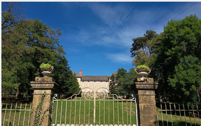
Le château d'Aubignac